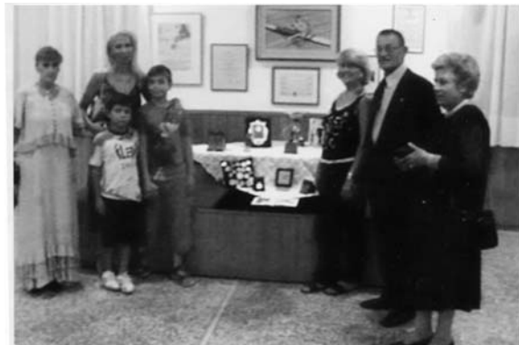
Εδώ με συγγενείς του

Ψηλός, ευθυτενής, με αθλητικό παράσημα ένιωσε τη χαρά της αναγνώρισης από τους συγχωριανούς του και ήταν ιδιαίτερα ενθουσιασμένος γι' αυτό. Θαυμάσα-