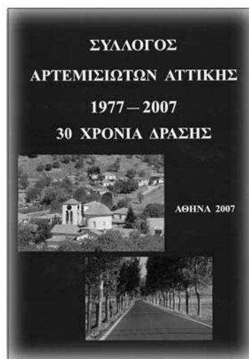
Το βιβλίο του Συλλόγου Αρτεμισιωτών Αττικής για τα 30 χρόνια δράσης 1977-2007

Ευχαριστούμε όλους όσους μας τίμησαν και συνετέλεσαν με τη συμμετοχή τους στην επιτυχία αυτής της εκδήλωσης, ενισχύο-