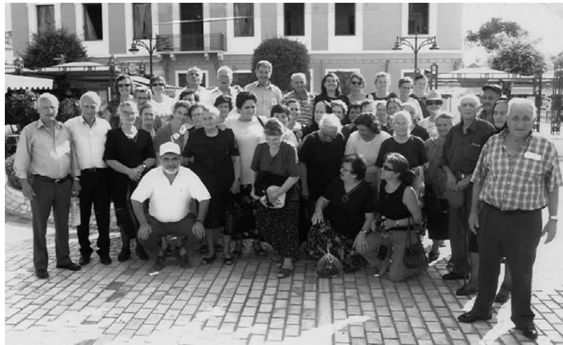
Εδώ μπροστά από το ρολόι της Πάτρας

τεράστια εντύπωση σε όλους μας. Είναι ένα σπουδαίο τεχνικό επίτευγμα που συνδέει την Πελοπόννησο με τη Στερεά Ελλάδα. Είναι έργο πνοής κι εξυπηρετεί χιλιάδες ταξιδιώτες. Με πρόχειρους υπολογισμούς περνούν τη γέφυρα 7.000 περίπου αυτοκίνητα την ημέρα. Η διέλευση των οχημάτων διαρκεί 2 λεπτά. Τα μο-