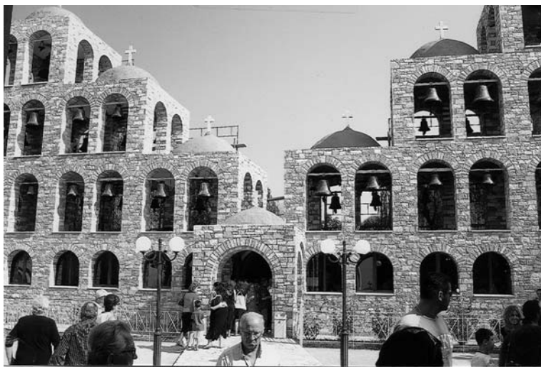
Οι 62 καμπάνες και τα 400 σήμαντρα

Υστερα από πρωτοβουλία του συλλόγου της Αθήνας πραγματοποιήθηκε στις 5 Αυγούστου 2007, ημέρα Κυριακή, επίσκεψη στο μοναστήρι «Άγιος Αυγουστίνος» των παπαροκάδων, στο Τρίκορφο Φωκίδας. Η συμμετοχή των συγχωριανών μας και σε αυτή την προσκυνηματική εκδρομή υπήρξε πολύ μεγάλη. Η αναχώρηση έγινε στις 6π.μ. από το καφενείο του Κωνσταντίνου Κέζα. Όλοι ήταν εκεί στην ώρα τους και γι' αυτό η αναχώρηση έγινε χωρίς καμία καθυστέρηση και χωρίς κανένα πρόβλημα. Μέσω της εθνικής οδού Τρίπολης - Κορίνθου - Πάτρας γύρω στις 8 φθάσαμε στο Ρίο. Η γέφυρα Ρίου Αντιρρίου προξένησε