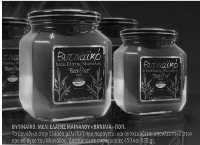
ΒΥΤΙΝΑΪΚΟ: ΜΕΛΙ ΕΛΑΤΗΣ ΜΑΪΝΑΛΟΥ «ΒΑΝΙΛΙΑ» ΠΟΠ. Το μοναδικό στην Ελλάδα μέλι ΠΟΠ που παράγεται και συσκευάζεται αποκλειστικά στον ορεινό όγκο του Μαϊνάου. Διατίθεται σε συσκευασίες 450 και 950 gr.

Ηδη το εργαστήριο παράγει δύο επώνυμα προϊόντα. Το μέ-