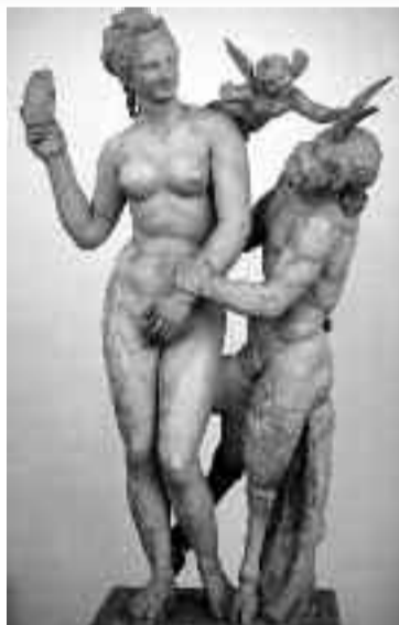
Μαρμάρινο σύμπλεγμα αγαλμάτων του Πάνα, της Αφροδίτης και του Έρωτα (Εθνικό Αρχαιολογικό Μουσείο)

Όταν έφτασε το βιβλίο αυτό στα χέρια μου διαπίστωσα ότι πρόκειται περί επιστημονικής διατριβής. Πρόκειται για διατριβή, με επαρκή γνώση των αρχαίων πηγών και εγκύρων νεωτέρων ιστορικών.