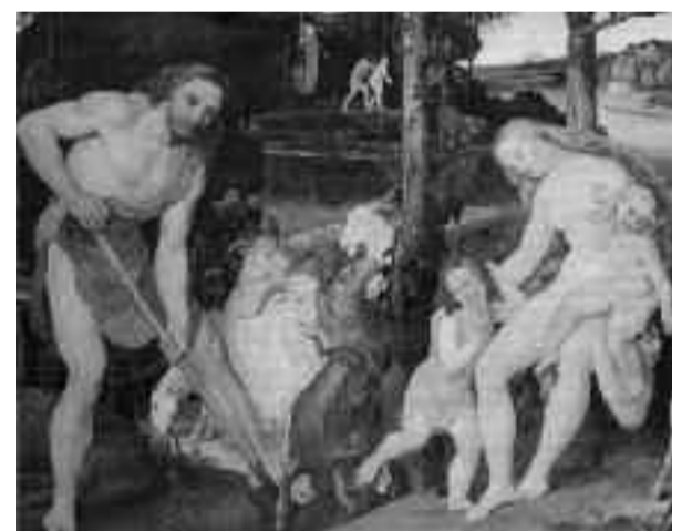
Ο Αδάμ και η Εύα μετά την έξωση από την Εδέμ

Όπως και να είναι, το σίγουρο βέβαια είναι ότι η πίστη