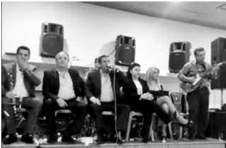
Η ορχήστρα εν δράσει! στην αίθουσα του Συλλόγου